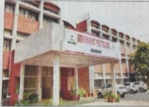
राजकीय बहुतकनीकी संस्थान, सोनीपत। संवाद

सोनीपत। हरियाणा विद्यालय शिक्षा बोर्ड की 10वीं व 12वीं कक्षाओं के परीक्षा परिणाम के घोषित होते ही बहु तकनीकी संस्थान में दाखिला प्रक्रिया का शेड्यूल जारी कर दिया है। इच्छुक विद्यार्थी 6 सितंबर तक तकनीकी शिक्षा प्राप्त करने के लिए ऑनलाइन आवेदन कर सकते हैं। नए शैक्षणिक सत्र की कक्षाएं एक अक्टूबर से शुरु होंगी। बहु तकनीकी संस्थान के अधिकारियों का कहना है कि अभी सीबीएसई के 10वीं व 12वीं कक्षाओं का परिणाम आना शेष है। ऐसे में अभी ऑनलाइन आवेदन प्रक्रिया धीमी रहेगी।