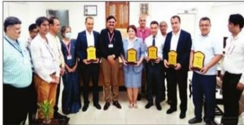
टीम के सदस्यों को स्मृति चिह्न देते संस्थान के प्रधानाचार्य व अन्य अधिकारी। संवाद

उज्बेकिस्तान से पहुंची टीम ने अपने देश में तकनीकी शिक्षा प्रसार की संभावनाओं के