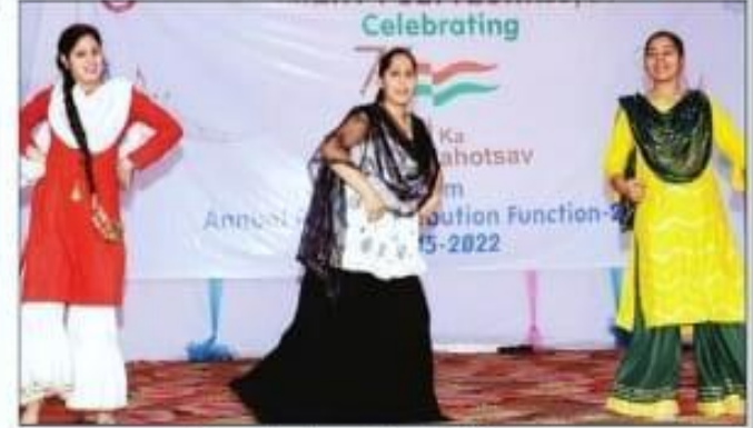
वार्षिक समारोह में नृत्य की प्रस्तुति देती छात्राएं।