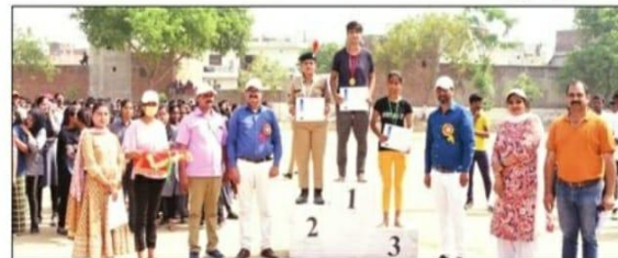
अतिथियों के साथ पदक व प्रमाणपत्र दिखाते विजेता खिलाड़ी।