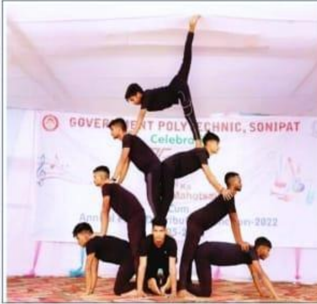
राजकीय बहुतकनीकी संस्थान में अपनी कला का प्रदर्शन करते विद्यार्थी।